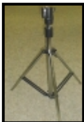
Stativ (Nr. M 008 U) Tripod (code M 008 U)