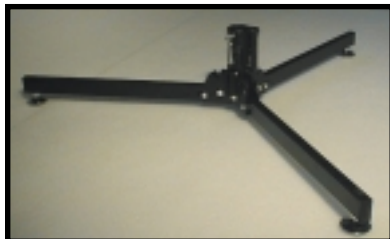
Bodenstativ (Nr. M 297 F Base) Base Tripod (code M 297 F Base)